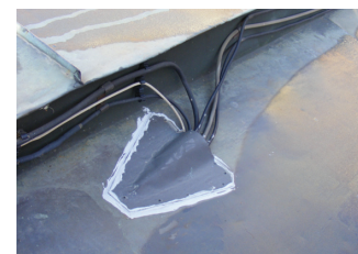
průchod přívodu napájení topných kabelů střešním pláštěm