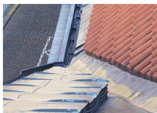
střešní žlab chráněný topným kabelem