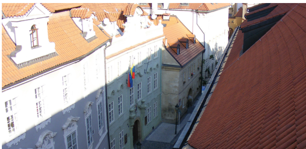
pohled přes malostranské střechy na typické řešení střešních krytin a okapů

Sídlo Parlamentu ČR je Národní kulturní památkou, kterou tvoří několik budov: Šternberský palác, Tomáškův palác, Valdštejnský palác, Kolovratský palác, Malý Fürstenberský palác a Thunovský palác.